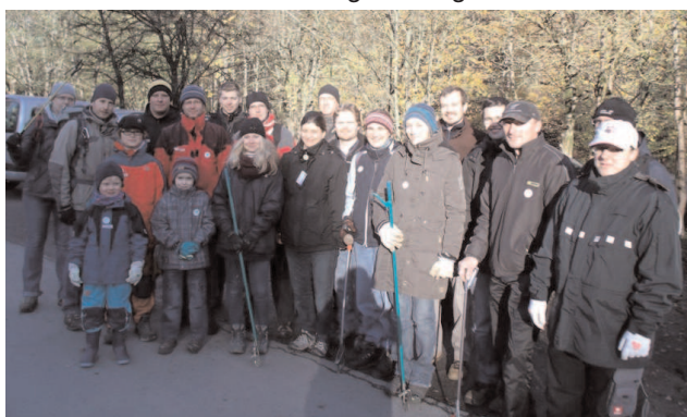
Die Helfer bei der Müllsammelaktion 2013