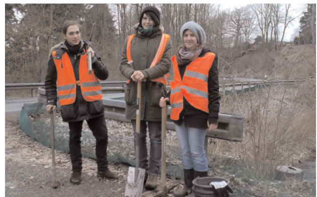
Aufbau des Krötenzaunes entlang der Möhneaeue.

Die regelmäßige Kontrolle der Sammelgefäße am Abend und am Morgen, sowie die Errichtung der Zäune ist nur mit engagierten Helfern möglich.