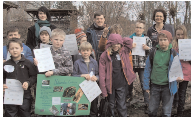
Die stolzen, neuen Bachpaten.

krebse, Köcherfliegen und Molchlarven genauer unter die Lupe. Die chemische Untersuchung ergab eine gute Wasserqualität. Mit einem Mittagessen gestärkt, zogen die Kinder los, um den Bach und die nähere Umgebung von Müll zu befreien und überhängendes Geäst zu entfernen, eine GPS-Wasserrallye zu erarbeiten und ein Plakat zum Gewässerschutz zu erstellen. Zum Abschluss erhielten die Mädchen und Jungen als Belohnung für den bestandenen Bachführer-schein eine Urkunde . Später berichteten sie mit viel Spaß und Interesse in ihren Klassen über die Gewässer-schutzaktivitäten. Durch die Teilnahme an den weiteren Liz- Angeboten wie dem Planktonkurs, vertieften sie ihre Umweltschutzkenntnisse.