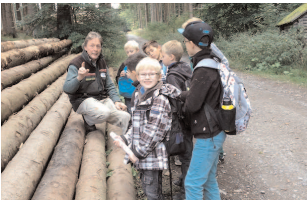
Erläuterungen auf dem Waldjugendspielparcours.

Wir freuen uns schon jetzt auf die Waldjugendspiele 2014 auf einem spannenden und abwechslungsreichen Parcours und hoffentlich wieder mit zahlreichen teilnehmenden Schulen.