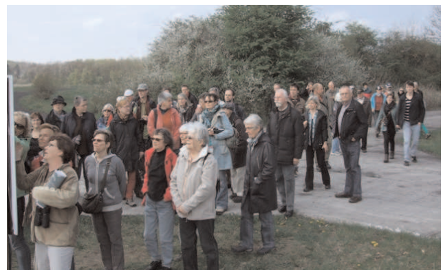
Besuchergruppe in der Weidelandschaft Kleiberg.

Besonders attraktiv für Wanderungen sind die neu angelegten Wege, der „ Kreesweg “ und der „ Soestweg “, die nun Soest und Möhnesee verbinden und zu erlebnisreichen Radtouren einladen.