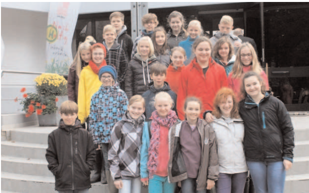
Die Schüler erlebten einen spannenden Tag am Möhnesee.

Ein spannender Tag am Möhnesee, bei dem selbst der Regenschauer am Nachmittag den Tatendrang der Nachwuchsforscher nicht bremsen konnte.