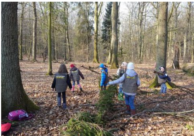
Ferienprogramm: Als Naturforscher unterwegs im Frühlingswald

Die besucherstärksten Monate waren 2018 der Juni (2.682 Besucher; 2017: 2.176) und der Oktober (1.696). Erfreulicherweise verteilen sich die Besucher*innen inzwischen gleichmäßiger auf die Monate im Jahr. Besucherschwächste Monate sind aber weiterhin der Februar (575) und Dezember (515).