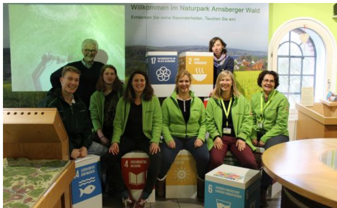
Das Liz Team 2018.