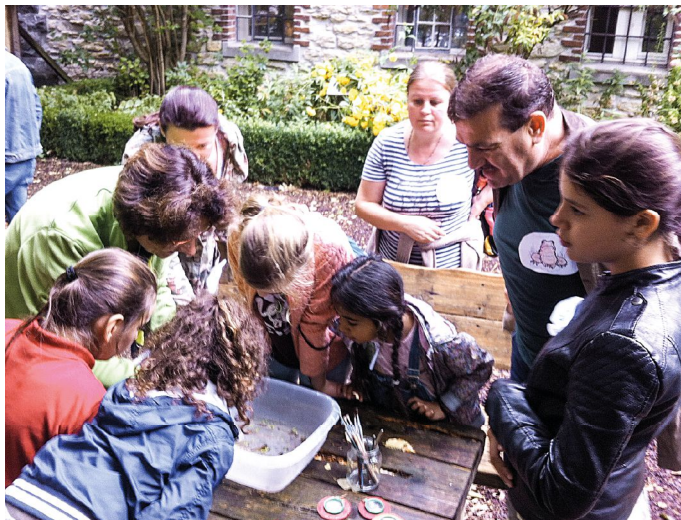
Praktisches internationales „Erleben am Teich“.

Im Rahmen des Verein Deutscher Naturparke (VDN)-Projektes „Natur erleben verbindet“, das vom Bundesamt für Naturschutz (BfN) und Bundesministerium für Umwelt (BMU) gefördert wird, hatten geflüchtete Familien mit Kindern im August die Gelegenheit, sich im Liz mit dem Thema „Erlebniswelt Wasser“ auseinanderzusetzen.