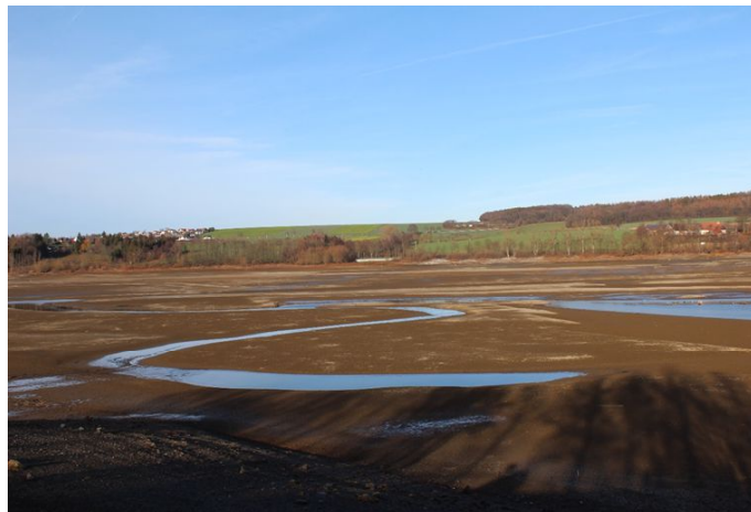
Die „leere“ Talsperre im Herbst 2018.