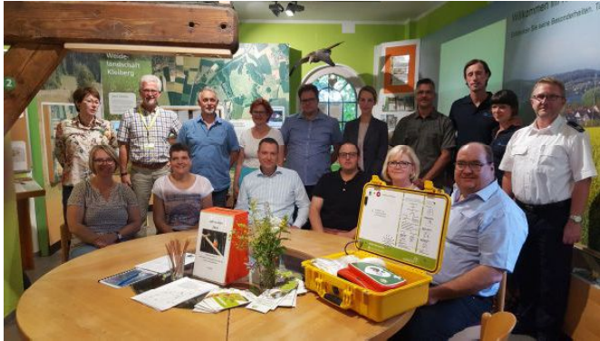
Zahlreiche Sponsoren ermöglichten die Anschaffung des Notfallkoffers im Liz.