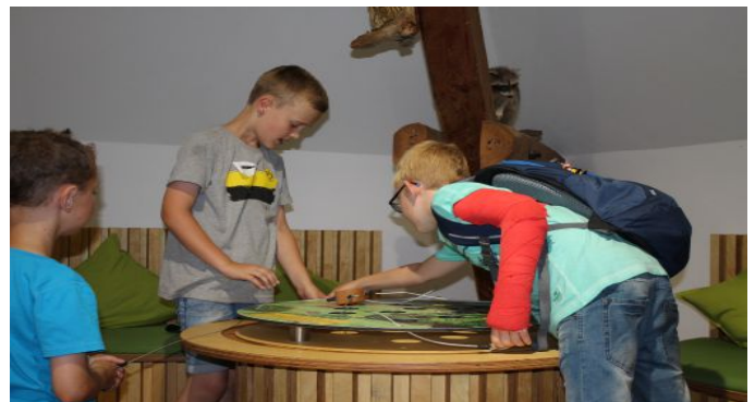
Das neue interaktive Eichhörnchenspiel.

Als neue Ausstellungsmodule erfolgten die Einrichtung einer Tiergeräusche- Station mit Filmen, die Ergänzung der Wald-Sinnesstation mit Tast-Sinnesstationen und die Einrichtung einer Spielecke mit einem Kugelspiel, Eichhörnchen im Waldökosystem, und einem Animationstisch zur Wald- und Klimasimulation. Auch die neuen Elemente sind besonders für blinde- und sehbehinderte Menschen und Migranten geeignet und in Profil- und Blindenschrift beschriftet. Die erste Besucherresonanz ist sehr positiv.